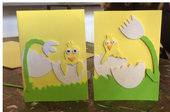
Der klippes påskeæg i moskus og laves små billeder og kort ved at kombinere moskus og karton.