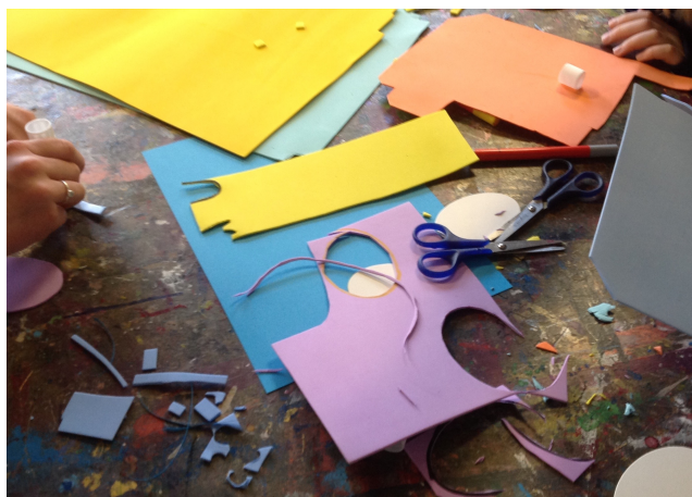
Materialerne er lagt frem, så eleverne kan se, hvad de kan arbejde med.